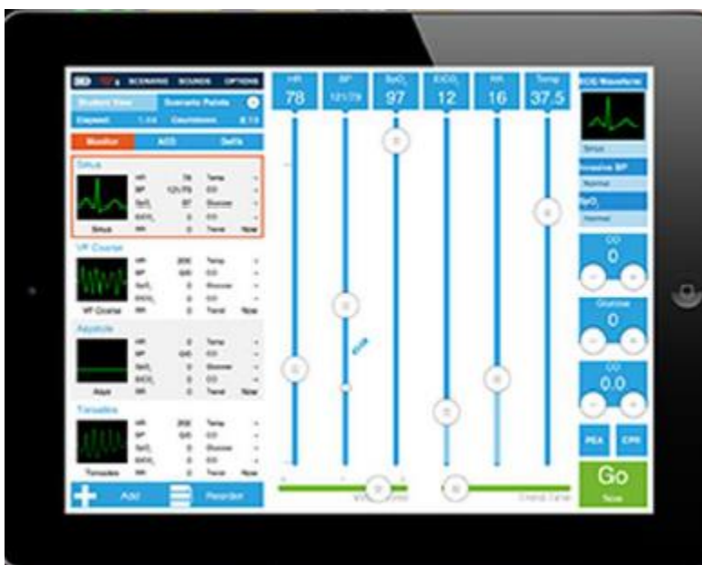
Obrázek č.1 – Náhled ovladače

Ovladač (viz obrázek č.1) bude v levé části obsahovat panel se záložkami pro zobrazení seznamu křivek a seznamu dat, které se odešlou, až po uplynutí dané doby. Uprostřed budou umístěny posuvníky pro nastavení hodnot viz 3.2. Dolní část bude obsahovat část pro nastavení prodlevy a tlačítko pro odeslání dat.